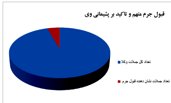
نمودار ۲. قبول جرم متهم و تاکید بر پشیمانی وی

بخشش بیشتری قرار دهد که این جمله نیز با هدف اقناع قاضی بیان شده است.