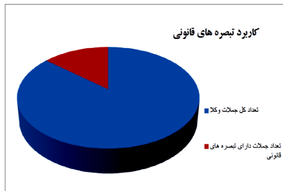
نمودار ۴. کاربرد تبصره های قانونی