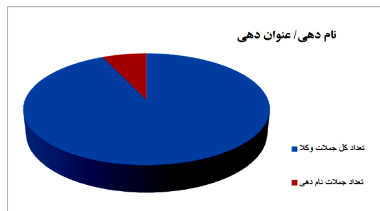
نمودار ۱. نام دهی و عنوان دهی Chart1. Titlization and nomination

بُعد دستوری- واژگانی: وکیل جمله‌ای خبری را مطرح می‌کند که نشان‌دهندهٔ احاطه و باور او بر اطلاعات است و به‌لحاظ کاربردشناسی، وکیل در دفاع از موکل خود سعی می‌کند که از مواد قانونی متفاوت بهره‌گیرد که این خود به‌طور ماهرانه‌ای باعث می‌شود تأثیر فراوانی بر قاضی ایجاد کند و درواقع این‌گونه جملات دارای نوعی کنش منظوری می‌باشند؛ زیرا جمله‌های ذکرشده توسط وکیل، دارای هیچ‌گونه الزامی در ظاهر نیستند، اما در متقاعدسازی مخاطب تأثیر بسزایی دارند.