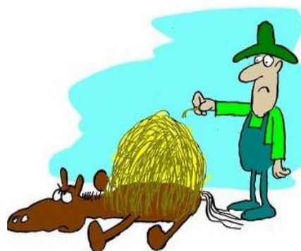
2. The Last Straw

باورها به تکان در می‌آیند و ارزش جدیدی ساخته می‌شود که مبنای آن همان رابطه حسی - ادراکی است که شوشگر دیداری با دنیایی که با آن روبه‌رو است، برقرار می‌کند (شعیری، ۱۳۸۵: ۱۹۶ - ۱۹۷). بُعد عاطفی گفتمان نیز در این کارتون به چشم می‌خورد به این صورت که عکس-العمل کسی که شمع‌ها را فوت کرده و سبب خرابکاری شده است، او را به عاملی موضع‌دار بدل کرده که حس شرمندگی را در گفته‌یاب ایجاد می‌کند و سبب می‌شود که او به ارزیابی عاطفی این تصویر بپردازد. پس، شناختی شوشی یا رخدادی در گفته‌یاب شکل می‌گیرد. عامل موضع‌دار عاملی است که نسبت به جریانی، دیدگاهی شخصی از خود بروز می‌دهد. دمیدن و فوت کردن در مورد چیزهای مختلفی می‌تواند انجام شود؛ ولی انتخاب اتفاقی معمول و ملموس مثل فوت کردن شمع کیک تولد، انتخاب بسیار مناسب و هوشمندانه‌ای در شکل‌گیری روایتی است که به درک معنای این اصطلاح زبانی منجر می‌شود. پس، اصطلاح blow it از طریق این کارتون به‌طور خلاقانه‌ای توسعه یافته و در این کارتون گونه‌های گفتمانی شناختی، حسی - ادراکی، عاطفی و زیبایی‌شناختی محقق شده است. در بررسی میدانی صورت گرفته، تعامل این کارتون با اصطلاح زبانی مرتبط، سبب شده است تا حدود ۸۹ درصد از زبان‌آموزانی که در ابتدا معنی اصطلاح را اشتباه تشخیص داده بودند، پس از رویارویی با این کارتون، جواب درست را انتخاب کنند که این میزان بالاترین نرخ پاسخ درست بعد از تعامل اصطلاح با کارتون بوده است و نشان می‌دهد که این کارتون مؤثرترین کارتون در میان ۱۵ کارتون مورد بررسی است.