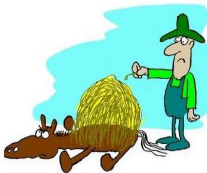
2. The Last Straw

باورها به تکان در می‌آیند و ارزش جدیدی ساخته می‌شود که مبنای آن همان رابطه حسی - ادراکی است که شوشگر دیداری با دنیایی که با آن روبه‌رو است، برقرار می‌کند (شعیری، ۱۳۸۵: ۱۹۶ - ۱۹۷). بُعد عاطفی گفتمان نیز در این کارتون به چشم می‌خورد به این صورت که عکس-العمل کسی که شمع‌ها را فوت کرده و سبب خرابکاری شده است، او را به عاملی موضع‌دار بدل کرده که حس شرمندگی را در گفته‌یاب ایجاد می‌کند و سبب می‌شود که او به ارزیابی عاطفی این تصویر بپردازد. پس، شناختی شوشی یا رخدادی در گفته‌یاب شکل می‌گیرد. عامل موضع‌دار عاملی است که نسبت به جریانی، دیدگاهی شخصی از خود بروز می‌دهد. دمیدن و فوت کردن در مورد چیزهای مختلفی می‌تواند انجام شود؛ ولی انتخاب اتفاقی معمول و ملموس مثل فوت کردن شمع کیک تولد، انتخاب بسیار مناسب و هوشمندانه‌ای در شکل‌گیری روایتی است که به درک معنای این اصطلاح زبانی منجر می‌شود. پس، اصطلاح blow it از طریق این کارتون به‌طور خلاقانه‌ای توسعه یافته و در این کارتون گونه‌های گفتمانی شناختی، حسی - ادراکی، عاطفی و زیبایی‌شناختی محقق شده است. در بررسی میدانی صورت گرفته، تعامل این کارتون با اصطلاح زبانی مرتبط، سبب شده است تا حدود ۸۹ درصد از زبان‌آموزانی که در ابتدا معنی اصطلاح را اشتباه تشخیص داده بودند، پس از رویارویی با این کارتون، جواب درست را انتخاب کنند که این میزان بالاترین نرخ پاسخ درست بعد از تعامل اصطلاح با کارتون بوده است و نشان می‌دهد که این کارتون مؤثرترین کارتون در میان ۱۵ کارتون مورد بررسی است.