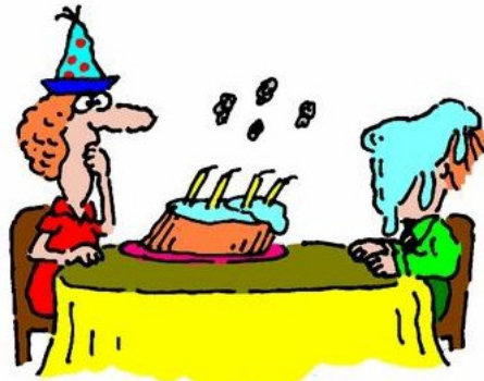
1. Blow it

اصطلاح زبانی و کارتون را رقم زده است. برای روشن‌تر شدن مطلب، تحلیل چهار مورد از کارتون‌ها ارائه می‌شود: