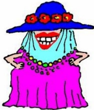
3. Dressed to the Teeth

تصویر شماره ۳، زنی خندان را نشان می‌دهد که لباس‌های زیاد و رنگارنگی پوشیده است به طوری که به جز دست‌ها و دهانش سایر قسمت‌های بدنش با لباس پوشانده شده‌اند. در این کارتون تلاش شده است تا معنای تحت‌اللفظی عبارت زبانی کاملاً به تصویر کشیده شود. زنی که در کارتون حضور دارد تا دندان لباس پوشیده است و هر تکه از لباسش یک رنگ دارد به طوری که هیچ‌گونه هماهنگی با هم ندارند. تناظر کامل میان متن تصویری با متن کلامی سبب ایجاد فشارهای قوی در این تصویر شده است. با توجه به اینکه هیچ عنصر هدایتگری در تصویر وجود ندارد تا بتواند این فشاره را به سمت گستره پیش ببرد، گویی مخاطب با تصویری مواجه است که زمان در آن منجمد است و به جز تعبیر از طریق معنای تحت‌اللفظی عبارت زبانی، چاره دیگری ندارد. مشاهده پاسخ‌های زبان‌آموزان، در بررسی میدانی، نشان می‌دهد که حضور این کارتون در کنار عبارت زبانی، نه تنها سبب تشخیص درست معنای عبارت زبانی نشده است؛ بلکه سبب شده تا ۸۲ درصد پاسخ‌های درست زبان‌آموزان به عبارت زبانی، بعد از مشاهده کارتون تبدیل به پاسخ غلط بشود. بررسی گزینه‌ها نشان از آن دارد که حدود ۷۸ درصد از پاسخ‌های درستی که غلط شده‌اند، گزینه «الف»، یعنی «تا دندان لباس پوشیدن» و تنها حدود ۲۲ درصد گزینه «ب»، یعنی «لباس پوشیده به تن کردن» بوده است. این نشان می‌دهد که کارتون مذکور زبان‌آموزان را از معنای اصطلاحی به سمت معنای تحت‌اللفظی برگردانده است و صرفاً بازنمودی از معنای ترکیبی عبارت زبانی بوده است.