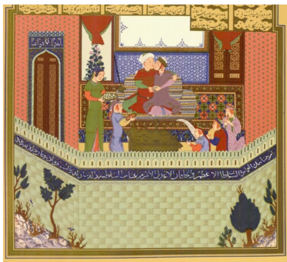
تصویر ۱: شاهنامه بایسنقری (۸۳۳ق): دیدار زال و رودابه

دارد که ماه را شرمگین می‌کند ... گویا آهو گردنش را از او وام گرفته است. شاخسار قدش را و شراب بوی خوشش را از او دارد. گل سرخی‌اش را وام‌دار گونه گلگون اوست» (الثعالبی ب، بی‌تا، ص. ۳۰): ب. «بوستان حسن است و پرتو آفتاب؛ مه‌پاره‌ای که خورشید از چهره‌اش سر برمی‌آورد و از گونه‌اش گل سرخ. چشمش افسون ساز می‌کند و شب سر بر دامن موی سیب‌هش می‌نهد» (الثعالبی ب، بی‌تا، ص. ۳۱). متن آ در توصیف امرد است و متن ب در توصیف دختر. سند دیگر نگاره‌های به‌جامانده از آن روزگارست که در آن پسر و دختر جوان، هر دو، همسان ترسیم شده‌اند: