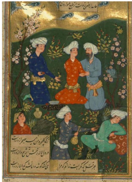
تصویر ۲: دیوان جامی؛ کتابت در سده دهم

گفتنی است که اهتمام به چهره خوب فقط در ابژگان مذکر ميل محل اعتنا نبوده، بلکه زیبایی مذکر، فی‌ذاته، مهم بوده است. بدین‌سبب در نگاره‌هایی که مذکران بالغ را ترسیم می‌کنند مختصات چهره آنان مانند روی امردان است مگر در ريش داشتن.