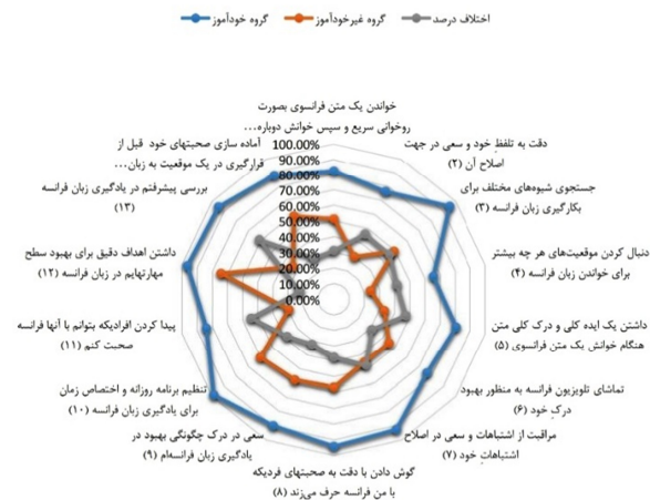
نمودار شماره ۱: تفاوت استفاده از راهبردهای فراشناختی در زبان‌آموزان خودآموز و غیر خودآموز Diagram No. 1: The difference in the use of metacognitive strategies by self-taught and non-self-taught language learners

یادگیری است. جامعه آماری افراد خودآموز با توجه به محدودیت تعداد افراد در این طیف، متشکل از افرادی از مشاغل، تحصیلات و سنین مختلف است. تعداد این خودآموزان ۳۵ نفر است که همگی آن‌ها ایرانی هستند، اما لزوماً همه آن‌ها ساکن ایران نیستند. در عین حال از تعداد ۳۵ نفر از افرادی که در هیچ دوره‌ای از یادگیری زبان فرانسه به‌صورت خودآموز عمل نکرده بودند نیز خواسته شد تا به دو پرسش‌نامه فوق‌الذکر پاسخ دهند. این گروه از زبان‌آموزان نیز از مشاغل، تحصیلات و سنین مختلف انتخاب شده‌اند. پرسش‌نامه شماره یک شامل ۱۴ سؤال است و در ارتباط با انواع مختلف راهبردهای فراشناختی است. پرسش‌نامه شماره دو شامل ۱۷ سؤال بوده و در ارتباط با انواع مختلف راهبردهای شناختی است. گفتنی است که هر پرسش سه گزینه دارد و در هر پرسش از زبان‌آموزان خواسته شد که در صورتی که این راهبرد را به‌ندرت انجام می‌دهند و یا هرگز انجام نمی‌دهند گزینه شماره ۱، در صورتی که گاهی اوقات آن را انجام می‌دهند گزینه شماره ۲ و در صورتی که اغلب اوقات یا همیشه آن را انجام می‌دهند گزینه شماره ۳ را علامت بزنند.