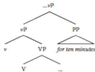
شکل ۱. جایگاه عبارت تداومی نمودار درختی

از دیدگاه مک‌دونالد (2008) و آلسینا (1999) عبارت تداومی به لحاظ نحوی با انواع محمول‌های نمودی سازگاری و مطابقت دارد و فقط برحسب اینکه محمول نهایت‌پذیر یا نهایت‌ناپذیر باشد دارای خوانش معنایی متفاوت خواهد بود. بدین صورت که عبارت تداومی در حضور موضوع درونی (مفعول) دارای کمیت خوانش نهایت‌پذیر تکریری دارد و در حضور موضوع درونی فاقد کمیت دارای خوانش تکرریدادی است. مک‌دونالد (2008, p.36) بر این باور است که عبارت تداومی به گروه فعلی کوچک می‌پیوندد و کل رویداد بیان‌شده توسط محمول را توصیف می‌کند، مانند گروه حرف اضافه‌ی for ten minutes در شکل ۱ زیر.