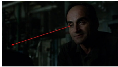
تصویر ۱۱: فصل دوم، قسمت دهم Picture11. Season 2, Episode 10