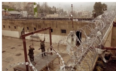
تصویر ۴: فصل اول، قسمت اول Picture4. Season 1, Episode 1