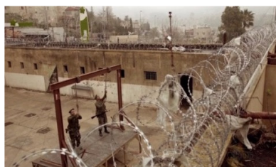
تصویر ۴: فصل اول، قسمت اول Picture4. Season 1, Episode 1