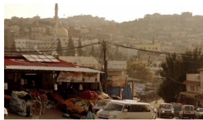
تصویر ۳: فصل اول، قسمت اول Picture3. Season 1, Episode 1