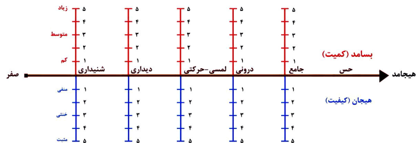
نمودار ۲: مؤلفه‌های هیجامد (پیش‌قدم، ۲۰۱۶)

به منظور شفاف‌سازی بیشتر این مدل، پیش‌قدم (۲۰۱۶) با در نظر گرفتن مؤلفه‌های سه‌گانه مستتر در هیجامد (بسامد (کمیت)، حس و هیجان (کیفیت)) نمودار ۲ را به تصویر کشیده است که این نمودار به سادگی بیانگر رابطه میان این سه مؤلفه است.