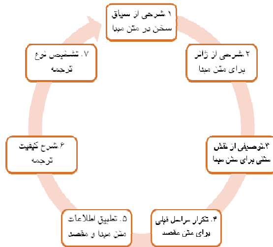
شکل ۲: مراحل اجرای الگوی جولیان هاوس Shape2. Steps of Julian House Pattern