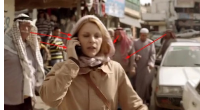
تصویر ۷: فصل اول، قسمت اول Picture7. Season 1, Episode 1