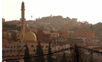
تصویر ۱: فصل اول، قسمت اول Picture1. Season 1, Episode 1