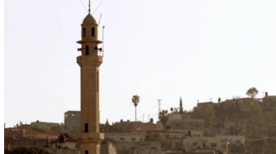
تصویر ۸: فصل اول، قسمت اول Picture8. Season 1, Episode 1