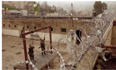
تصویر ۴: فصل اول، قسمت اول Picture4. Season 1, Episode 1