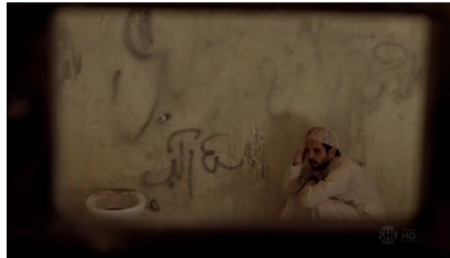
تصویر ۹: فصل اول، قسمت اول Picture9. Season 1, Episode 1