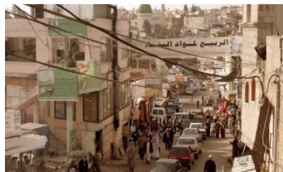
تصویر ۶: فصل اول، قسمت اول Picture6. Season 1, Episode 1