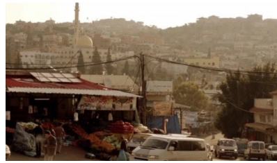
تصویر ۳: فصل اول، قسمت اول Picture3. Season 1, Episode 1