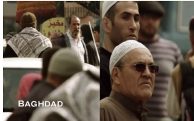
تصویر ۲: فصل اول، قسمت اول Picture2. Season 1, Episode 1