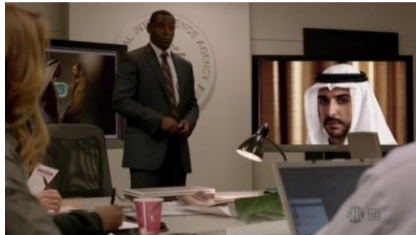
تصویر ۱۰: فصل اول، قسمت سوم Picture10. Season 1, Episode 3