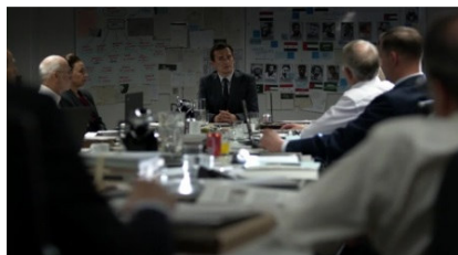
تصویر ۱۴: فصل پنجم، قسمت اول Picture14. Season 5, Episode 1