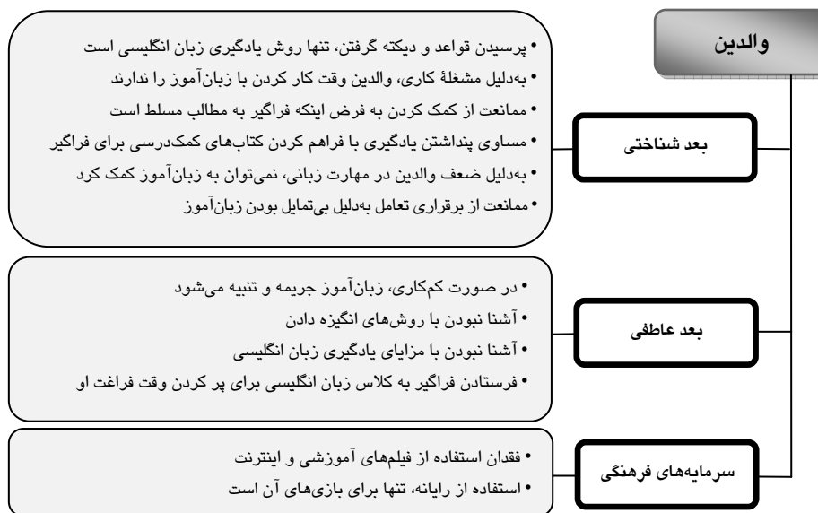
شکل ۳ طبقه‌بندی مشخصه‌های آموزشی رایج در والدین زبان‌آموزان ضعیف