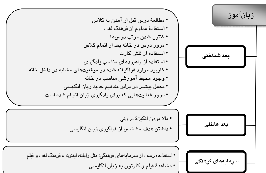
شکل ۴ طبقه‌بندی مشخصه‌های آموزشی رایج در زبان‌آموزان قوی

در گروه زبان‌آموزان قوی، بعد شناختی بیش از هر چیز در شکل ۳ مورد توجه است. بعضی از زبان‌آموزان گفتند که در پایان روز کارهایی را که برای یادگیری زبان انجام داده‌اند، روی کاغذ می‌نویسند و به والدین خود نشان می‌دهند. این کار در پیشرفت و رشد ذهنی آن‌ها