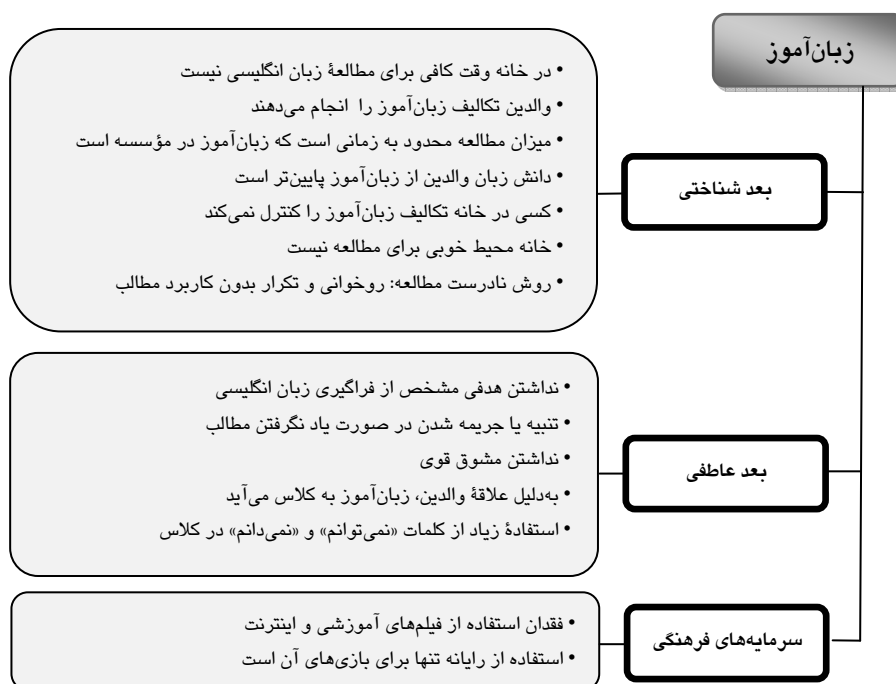
شکل ۲ طبقه‌بندی مشخصه‌های آموزشی رایج در زبان‌آموزان ضعیف

شکل ۲ شامل مواردی است که از مصاحبه‌های زبان‌آموزان ضعیف مورد مطالعه این تحقیق استخراج شدند. همان‌طور که در شکل مشخص است محیط آموزشی مناسبی برای این زبان‌آموزان مهیا نشده است. زبان‌آموزان در بعد عاطفی که برخی معتقدند چراغ سبزی برای پیشرفت در بعد شناختی است (Goleman, 1995; Brown, 2007)، در وضعیت مساعدی نیستند. شایسته است که والدین میل و نیاز به یادگیری زبان را در فرزندان خود ارتقاء دهند و ابعاد عاطفی زبان‌آموز را تقویت کنند. در برخی از خانواده‌ها دیده می‌شود که یادگیری زبان انگلیسی وظیفه محسوب می‌شود