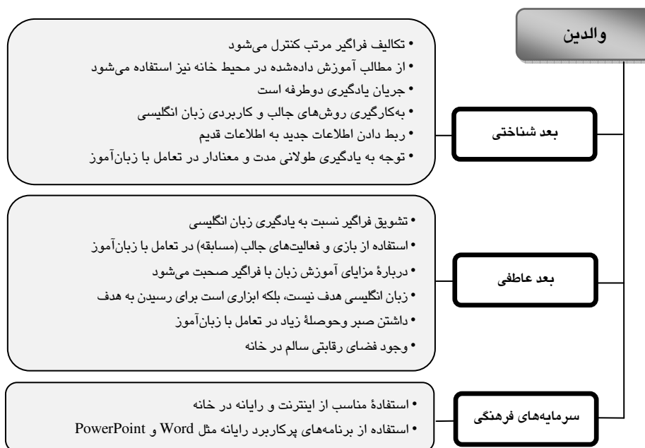
شکل ۵ طبقه‌بندی مشخصه‌های آموزشی رایج در والدین زبان‌آموزان قوی