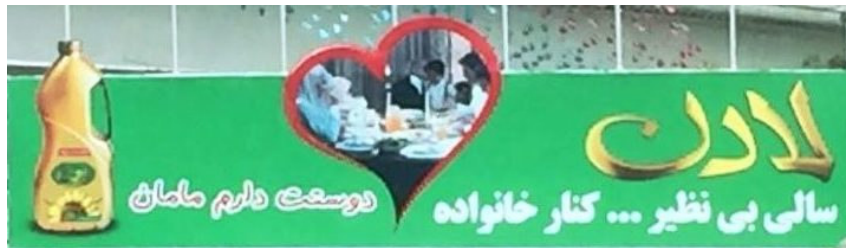
نمونه ۱: روغن مایع گیاهی لادن