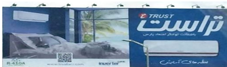
نمونه ۴: کولرهای گازی تراست

گفتمان‌سازی تصویر نظام اتصال ایجاد کرده است. در این تصویر که متن دیداری تلقی می‌شود شرایط حسی - ادراکی تعیین‌کننده رابطه میان مخاطب با متن دیداری است و بر اساس همین رابطه معنا کنونیت می‌یابد. به عبارت دیگر، این معنا همان معنای در حال «شدن» است که در رابطه حسی - ادراکی بین بیننده و متن (مشخصاً تصویر) شکل می‌گیرد. تصویری سیال که بر اساس تولید رابطه عاطفی به صورت شوشی قابل تبیین است.