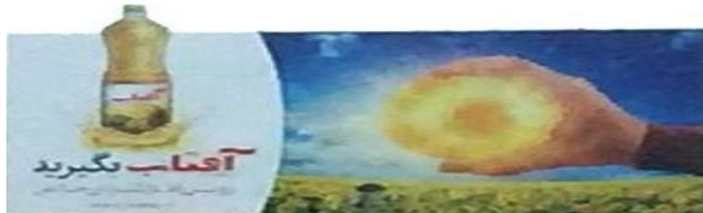
نمونه ۲: روغن مایع گیاهی آفتاب

کمک زبان و یافت انتقال می‌یابد. آغازگر بند «سالی بی‌نظیر» است که اطلاع نو محسوب شده و در سمت راست تصویر آمده است؛ یعنی تأکید به داشتن سالی بی‌نظیر به سبب مصرف سالانه و مداوم این کالای با کیفیت «کنار خانواده» (همراه با عکس خانواده) و یا بند «دوستت دارم مامان» تأکید به دوست داشتن (همراه با عکس قلب) که اطلاع کهنه محسوب شده می‌شوند و در سمت چپ آن قرار دارند. گفتنی است راست و چپ هر تصویر با توجه به راست و چپ بیننده آن تصویر مشخص می‌شود. به همین سبب در فرهنگ ما با توجه به شکل نوشتار راست به چپ اهمیت دارد و اطلاعات نو و کهنه این بیلبورد نیز در این ارتباط شکل گرفته‌اند. با استناد به سازوکارهای نظری موجود در نقش‌گرایی، بازنمایی فرانش متنی در این تبلیغ بدین صورت است که تصویر و شکل ظاهری بیلبورد با متن، محتوا و آنچه در آن مرقوم شده است، به‌گونه‌ای واحد از طریق بازتولید متنی منسجم و دارای پیوستگی لازم، هر دو در یک راستا در پیشبرد و بیان معنا کوشیده‌اند.