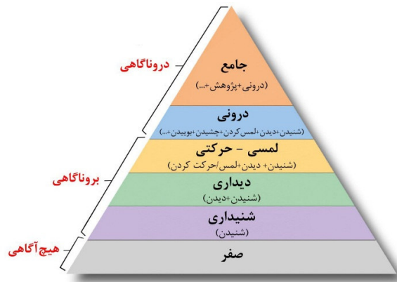
نمودار ۲: هرم هیجامد (Pishghadam, 2016)

تفحص، به هیجامد جامع از آن واژه دست یابد و خود را به مرحله درون آگاهی ۱۳ برساند. در این مرحله، درک کاملاً دقیقی از آن واژه یا مفهوم مورد نظر شکل خواهد گرفت. برای درک بهتر سطوح هیجامد می توان نمودار ۲ را نیز نشان داد: