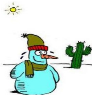
4. Snow Job

در تصویر شماره ۴ یک آدم‌برفی به رنگ آبی دیده می‌شود، در حالی که عرق می‌ریزد و با پوزخندی بر لب به کاکتوسی که در سمت راست و عقب تصویر است نگاه می‌کند. خورشید سوزان، کاکتوس بیابانی موجود در تصویر و عرقی که از سر و صورت آدم‌برفی می‌ریزد نشان از گرما و بیابانی بودن فضای تصویر شده دارد. تنها نقطه اتصال میان عبارت زبانی و تصویر، برفی بودن جنس آدم برفی - آن هم بر اساس شناخت ناشی از تجربه - است. از طرف دیگر، حضور آدم‌برفی در بیابان گرم آن هم در حالی که به‌نظر خوشحال می‌آید سرشار از تناقض و ناپیوستگی است، به‌طوری که ربط منطقی برای شکل‌گیری یک روایت در ذهن ایجاد نمی‌شود. عدم موفقیت کار تو نیست در برقراری اتصال اولیه درست میان تصویر و عبارت زبانی سبب شده است تا فضای تنشی لازم برای توسعه خلاق عبارت زبانی به درستی شکل نگیرد؛ اما حتی اگر برفی بودن آدم‌برفی را نقطه حرکت به سمت معناسازی و لبخند زیرکانه آدم‌برفی آبی رنگ را به‌منزله موضوعی که سبب انفصال و حرکت به سمت گستره شده است، در نظر بگیریم. این لبخند زیرکانه مخاطب را به هیچ کجا هدایت نمی‌کند؛ زیرا مسیر حرکت جهت‌مند و پیوسته نیست. عناصری که تصویر شده‌اند، پُر از تناقض هستند به‌گونه‌ای که نمی‌توان از کنار هم قرار دادن آن‌ها روایتی معنی‌دار ساخت. به‌نظر می‌رسد کارتون‌نویس قصد دارد تا دنیایی جدید خلق کند و به این ترتیب شناختی درون‌گفتمانی را شکل دهد؛ اما نه تنها موفق به انجام این کار نشده است؛ بلکه متنی گسسته و پراکنده ساخته است که حتی از طریق ارجاع به عالم خارج و شناخت حاصل از تجربه قلبی هم نمی‌توان نظام خاصی را برای آن متصور شد. آمار حاصل از بررسی میدانی نیز نشان