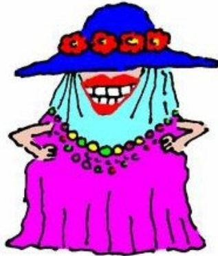
3. Dressed to the Teeth

تصویر شماره ۳، زنی خندان را نشان می‌دهد که لباس‌های زیاد و رنگارنگی پوشیده است به طوری که به جز دست‌ها و دهانش سایر قسمت‌های بدنش با لباس پوشانده شده‌اند. در این کارتون تلاش شده است تا معنای تحت‌اللفظی عبارت زبانی کاملاً به تصویر کشیده شود. زنی که در کارتون حضور دارد تا دندان لباس پوشیده است و هر تکه از لباسش یک رنگ دارد به طوری که هیچ‌گونه هماهنگی با هم ندارند. تناظر کامل میان متن تصویری با متن کلامی سبب ایجاد فشارهای قوی در این تصویر شده است. با توجه به اینکه هیچ عنصر هدایتگری در تصویر وجود ندارد تا بتواند این فشاره را به سمت گستره پیش ببرد، گویی مخاطب با تصویری مواجه است که زمان در آن منجمد است و به جز تعبیر از طریق معنای تحت‌اللفظی عبارت زبانی، چاره دیگری ندارد. مشاهده پاسخ‌های زبان‌آموزان، در بررسی میدانی، نشان می‌دهد که حضور این کارتون در کنار عبارت زبانی، نه تنها سبب تشخیص درست معنای عبارت زبانی نشده است؛ بلکه سبب شده تا ۸۲ درصد پاسخ‌های درست زبان‌آموزان به عبارت زبانی، بعد از مشاهده کارتون تبدیل به پاسخ غلط بشود. بررسی گزینه‌ها نشان از آن دارد که حدود ۷۸ درصد از پاسخ‌های درستی که غلط شده‌اند، گزینه «الف»، یعنی «تا دندان لباس پوشیدن» و تنها حدود ۲۲ درصد گزینه «ب»، یعنی «لباس پوشیده به تن کردن» بوده است. این نشان می‌دهد که کارتون مذکور زبان‌آموزان را از معنای اصطلاحی به سمت معنای تحت‌اللفظی برگردانده است و صرفاً بازنمودی از معنای ترکیبی عبارت زبانی بوده است.