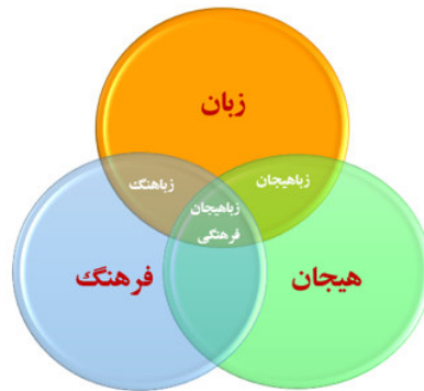
شکل ۱: زباهیجان فرهنگی

با توجه به موارد اشاره شده و اهمیت هیجان‌ها در انعکاس تفکرات، زبان و فرهنگ هر جامعه، نگارندگان در پژوهش حاضر مفهومی به‌نام زباهیجان‌های فرهنگی را معرفی می‌کنند که به هیجان‌هایی اشاره دارند که در پشت عبارات‌های زبانی نهفته هستند و در یک فرهنگ خاص ممکن است معانی منحصر به فرد خود را داشته باشند. با معرفی زباهیجان می‌توان بُعد هیجانی را به الگوی قوم‌نگاری ارتباط افزود و آن را به قوم‌نگاری هیجانی ارتباط بسط داد. این مهم شکاف میان مطالعات جامعه‌شناسی و روان‌شناسی را کم‌رنگ می‌کند. شکل ۲ رابطه میان زبان، فرهنگ و هیجان را به‌خوبی به‌تصویر می‌کشد: