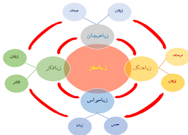
شکل ۱: الگوی زبانمغز (پیش‌قدم و ابراهیمی، ۱۳۹۹، ص. ۹)