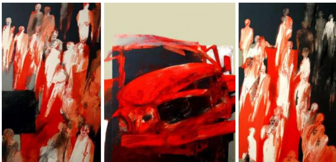
Fig. 9. S  rie « Junkyard cars »

Et, si on veut suivre une sorte de gradation, on aboutit au visage   nigmatique et effrayant de quelque figure d'outre-monde qui fixe et sid  re son observateur timor   en contre-bas (figure 10). Bien entendu ce rapide parcours    travers les formes de visages rel  ve d'un agencement second, et d'une certaine libert   interpr  tative. Mais il est int  ressant d'observer, dans ces deux derniers visages des « Junkyard cars » (figure 9 et 10) un renversement formel de la rection figurative et des modes d'existence formels des deux figures en jeu : dans le premier cas (figure 9) la figure du « v  hicule » est actualis  e et celle du « visage », virtuelle, n'acc  de que peu    peu    l'actualisation. Le « v  hicule » r  git donc le « visage ». Cette rection explique peut-  tre l'effet d'incorporation qu'on a observ  . Dans le second cas (figure 9), c'est l'inverse : le visage appara  t en premier, m  me monstrueux, avec ses deux yeux   cart  s dont l'un est surmont   d'un sourcil g  ant, le rictus de sa bouche d  chirant la face d'un bord    l'autre, son nez r  duit    une gigantesque fosse nasale... Et ce n'est que dans un second temps que le v  hicule accident   se dessine avec ses constituants, son capot, ses phares. Le « visage » r  git donc le « v  hicule ».