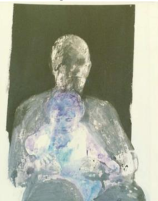
Fig. 3. Série «Figures»