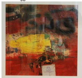
Fig. 5. Série «Graffiti»