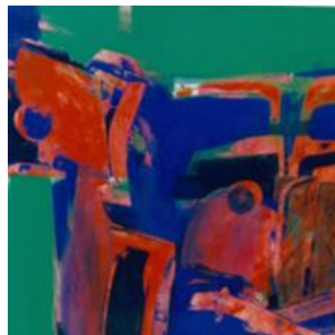
Fig. 7. Série «Puzzled cars»