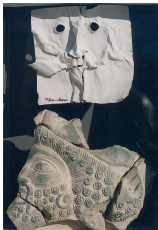
Fig. 2. Série «Archamanians»