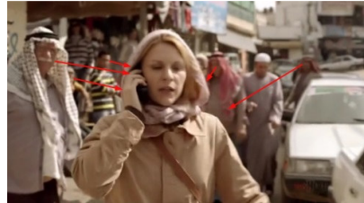
تصویر ۷: فصل اول، قسمت اول Picture7. Season 1, Episode 1