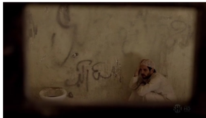
تصویر ۹: فصل اول، قسمت اول Picture9. Season 1, Episode 1