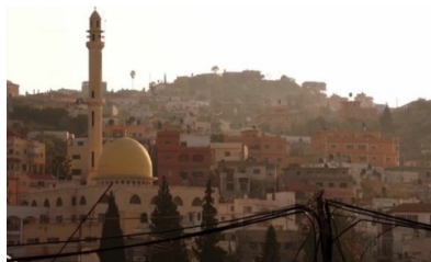
تصویر ۱: فصل اول، قسمت اول Picture1. Season 1, Episode 1