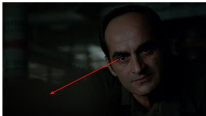
تصویر ۱۲: فصل دوم، قسمت دهم Picture12. Season 2, Episode 10