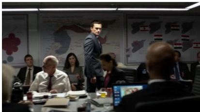
تصویر ۱۳: فصل پنجم، قسمت اول Picture13. Season 5, Episode 1