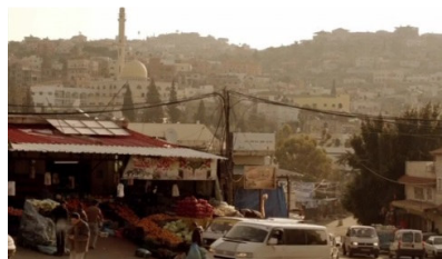
تصویر ۳: فصل اول، قسمت اول Picture3. Season 1, Episode 1