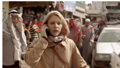
تصویر ۷: فصل اول، قسمت اول Picture7. Season 1, Episode 1