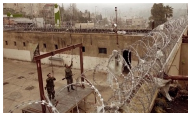
تصویر ۴: فصل اول، قسمت اول Picture4. Season 1, Episode 1