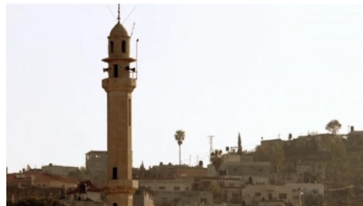
تصویر ۸: فصل اول، قسمت اول Picture8. Season 1, Episode 1