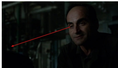
تصویر ۱۱: فصل دوم، قسمت دهم Picture11. Season 2, Episode 10