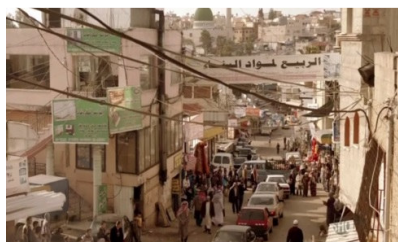
تصویر ۶: فصل اول، قسمت اول Picture6. Season 1, Episode 1