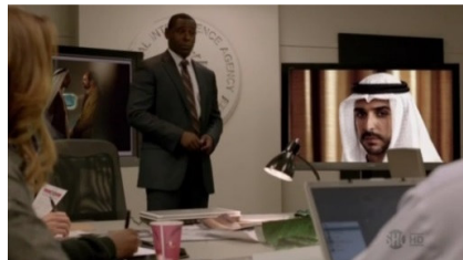
تصویر ۱۰: فصل اول، قسمت سوم Picture10. Season 1, Episode 3