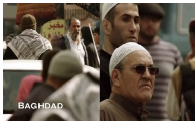
تصویر ۲: فصل اول، قسمت اول Picture2. Season 1, Episode 1