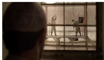
تصویر ۵: فصل اول، قسمت اول Picture5. Season 1, Episode 1