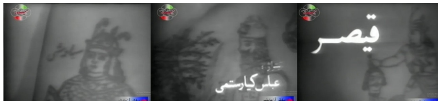
نمونه ۲: تن‌نگاشته در تیتراژ فیلم قیصر مسعود کیمیایی