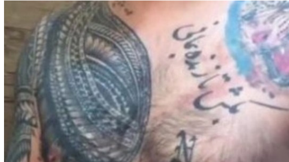
نمونه ۴: تن نگاشته (عبارت بکش تا زنده بمانی) (منبع: سایت اینترنتی)