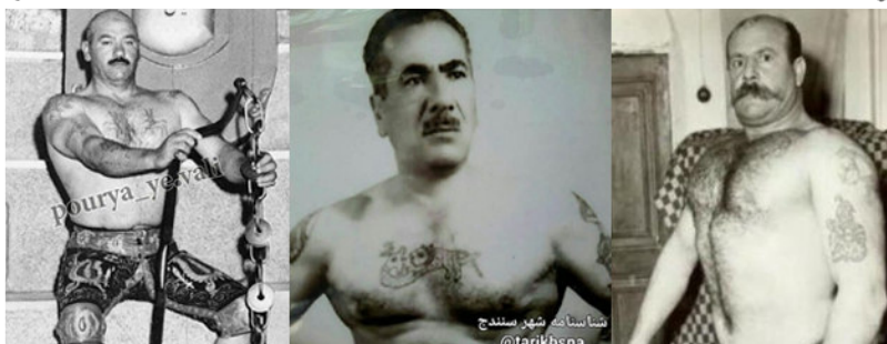
نمونه ۳: نقش خال روی تن ورزشکاران زورخانه

Example 3: The role of a mole on the body of Zurkhaneh athletes.