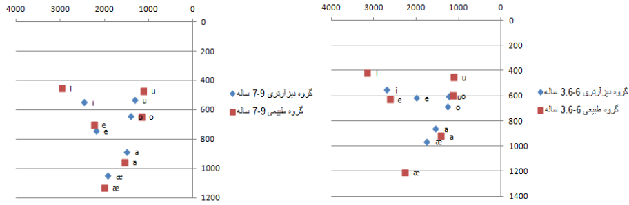
تصویر ۱. فضای واکه‌ای در دو گروه کودکان دارای دیزآرتری و طبیعی بر حسب هرتز