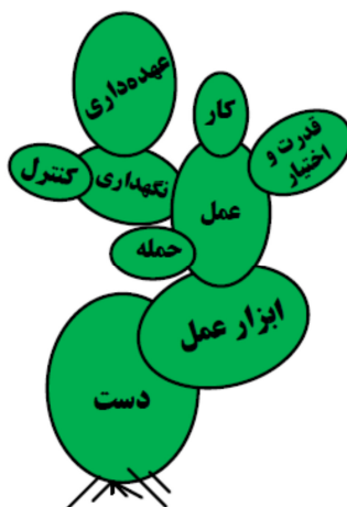
شکل ۲. الگوی کاکتوسی از تغییرات معنایی واژه دست (shou) در چینی (Vide. Min & Wenbin, 2008: 7)