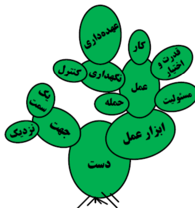
شکل ۱. الگوی کاکتوسی از تغییرات معنایی واژه دست (hand) در انگلیسی (Vide. Min & Wenbin, 2008: 7)