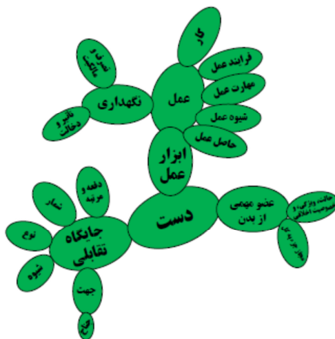
شکل ۳. الگوی کاکتوسی از تغییرات معنایی واژه دست در فارسی

۴. دست ← ابزار انجام کار و عمل ← کار و عمل ملموس ← عمل نگاه‌داشتن انتزاعی ← کنترل کردن ← مالکیت لداخلت و تأثیر