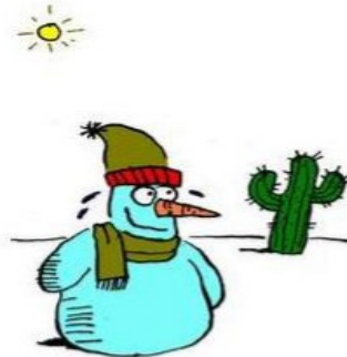
4. Snow Job

در تصویر شماره ۴ یک آدم‌برفی به رنگ آبی دیده می‌شود، در حالی که عرق می‌ریزد و با پوزخندی بر لب به کاکتوسی که در سمت راست و عقب تصویر است نگاه می‌کند. خورشید سوزان، کاکتوس بیابانی موجود در تصویر و عرقی که از سر و صورت آدم‌برفی می‌ریزد نشان از گرما و بیابانی بودن فضای تصویر شده دارد. تنها نقطه اتصال میان عبارت زبانی و تصویر، برفی بودن جنس آدم برفی - آن هم بر اساس شناخت ناشی از تجربه - است. از طرف دیگر، حضور آدم‌برفی در بیابان گرم آن هم در حالی که به‌نظر خوشحال می‌آید سرشار از تناقض و ناپیوستگی است، به‌طوری که ربط منطقی برای شکل‌گیری یک روایت در ذهن ایجاد نمی‌شود. عدم موفقیت کار تو نیست در برقراری اتصال اولیه درست میان تصویر و عبارت زبانی سبب شده است تا فضای تنشی لازم برای توسعه خلاق عبارت زبانی به درستی شکل نگیرد؛ اما حتی اگر برفی بودن آدم‌برفی را نقطه حرکت به سمت معناسازی و لبخند زیرکانه آدم‌برفی آبی رنگ را به‌منزله موضوعی که سبب انفصال و حرکت به سمت گستره شده است، در نظر بگیریم. این لبخند زیرکانه مخاطب را به هیچ‌کجا هدایت نمی‌کند؛ زیرا مسیر حرکت جهت‌مند و پیوسته نیست. عناصری که تصویر شده‌اند، پُر از تناقض هستند به‌گونه‌ای که نمی‌توان از کنار هم قرار دادن آن‌ها روایتی معنی‌دار ساخت. به‌نظر می‌رسد کارتون‌نویست قصد دارد تا دنیایی جدید خلق کند و به این ترتیب شناختی درون‌گفتمانی را شکل دهد؛ اما نه تنها موفق به انجام این کار نشده است؛ بلکه متنی گسسته و پراکنده ساخته است که حتی از طریق ارجاع به عالم خارج و شناخت حاصل از تجربه قلبی هم نمی‌توان نظام خاصی را برای آن متصور شد. آمار حاصل از بررسی میدانی نیز نشان