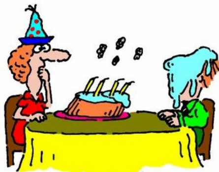
1. Blow it

اصطلاح زبانی و کارتون را رقم زده است. برای روشن‌تر شدن مطلب، تحلیل چهار مورد از کارتون‌ها ارائه می‌شود: